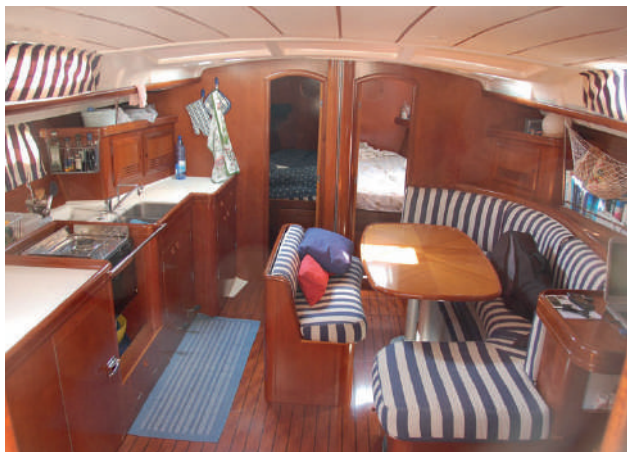
Foto degli interni e dell'esterno della nostra barca "Yemanja" modello Beneteau 473